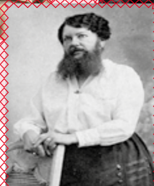
CLÉMENTINE DELAIT Femme à barbe