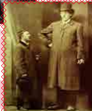
ÉDOUARD BEAUPRÉ Le géant