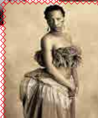
SAATJIE BAARTMAN La Vénus Hottentote