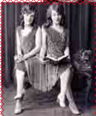
DAISY ET VIOLET HILTON Sœurs siamoises