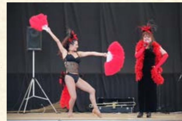
Spectacle à travers des pays du monde

3 danseuses, un chanteur et une chanteuse entraineront le public à travers les différents pays du monde durant près de 1h45.