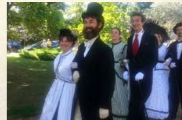
Lectures et scénettes autour des romans

À chaque représentation, les artistes transportent les spectateurs au XIX ème siècle, véritable immersion dans la société et la culture d'époque.