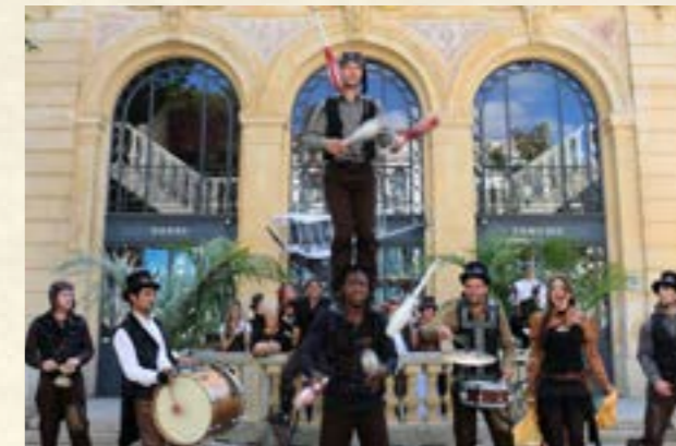
La Caravane de Soukha

7 artistes animeront l'Esplanade du Casino avec des déambulations, musique et danses. Il présenteront également à 16h, un spectacle de mât chinois.