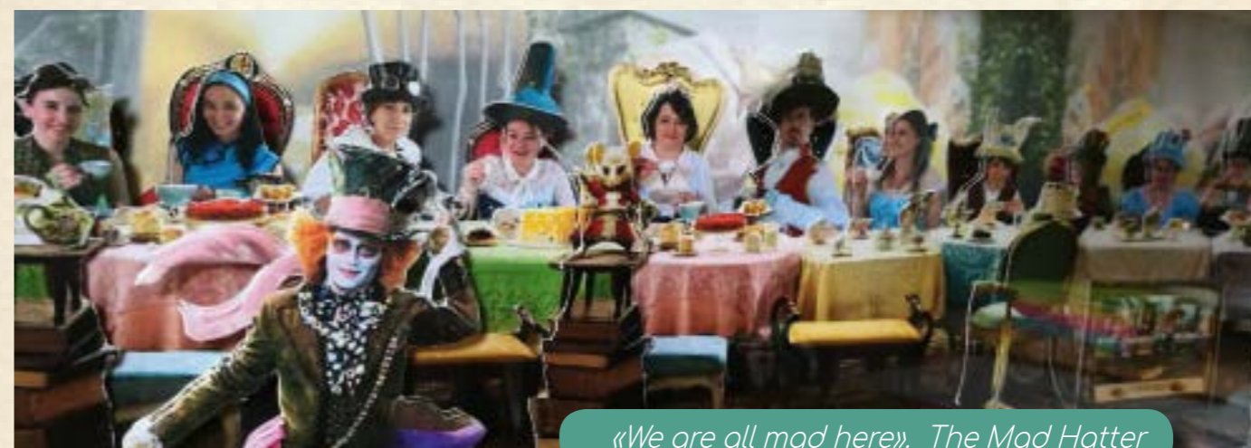
«We are all mad here». The Mad Hatter

L'Office de Tourisme et d'Animation revisite un classique de la littérature jeunesse au 19 e siècle et propose cette année un «Déjeuner de Non-Anniversaire», inspiré du célèbre conte «Alice aux Pays des Merveilles».